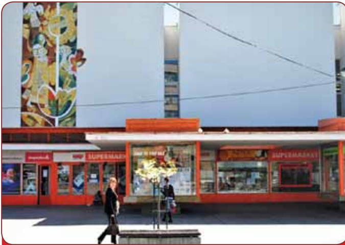
Obchodný dom DODO dodnes slúži svojmu účelu.