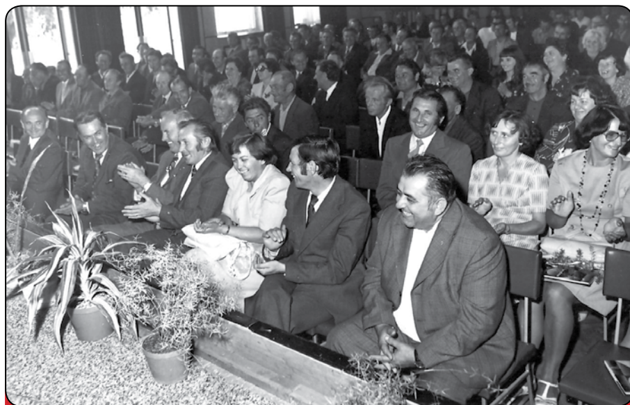
Foto z osláv 25. výročia založenia Chemkostavu. Pracovníci STAS 200 Michalovce. Klub poľnohospodárov - terajšia Vysoká škola Ekonomická.

Ako som spomínal začínal som na Projekcii. Následne som musel absolvovať Základnú vojenskú službu na prelome rokov 1962-1963, po návrate v roku 1963 som šiel na stavbu Dopravného závodu mesta Košice, ktorý stojí dodnes. Zo STAS 26 som však nastúpil do STAS 22 so sídlom na Sladovni, ktorú každý určite pozná. STAS 22 mal už stavby aj v Košiciach, tam som pôsobil v pozícii stavbyvedúceho. V roku 1966 sa pretransformoval STAS 22 na STAS 200, ktorý pôsobil ako Chemkostav až do svojho zániku. Myslím, že budova, kde bolo zriadené stavenisko dodnes slúži svojmu účelu a sídli v nich Dopravný podnik Košice.