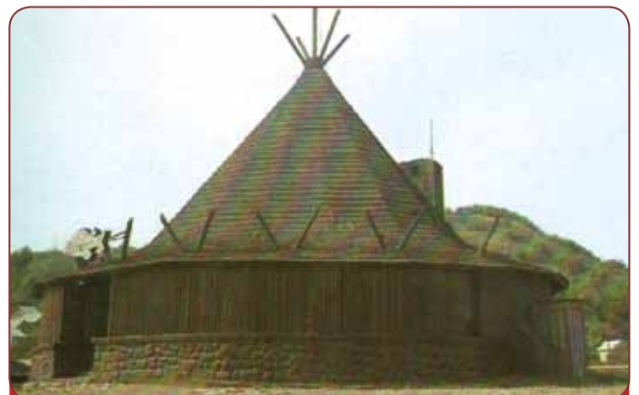
Rybárska Koliba na Zemplínskej šírave.

Výstavba pivovaru Šariš začala 1. septembra 1964 a po dva a pol roku výstavby bol dokončený s kapacitou 600 000 hl piva. Svoju novodobú históriu začal pivovar písať 26. mája 1967, kedy bola uverená prvá várka piva - 10 % svetlé pivo Šariš. Značka Šariš sa vďaka dobrej kvalite veľmi rýchlo dostala do povedomia spotrebiteľskej verejnosti tak na vnútornom trhu, ale aj v zahraničí.