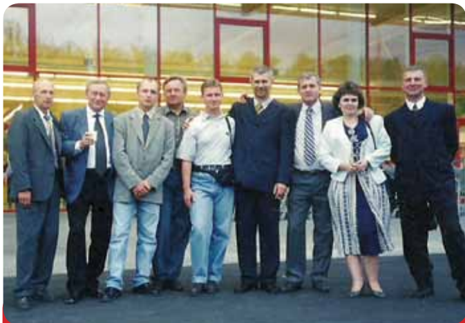
Na odovzdaní supermarketu Billa Kyjev na Ukrajine. Na foto z ľava:

Výstavba III Veží je druhá najväčšia zákazka Chemkostavu, a.s.. Spoločnosť prešla úspešne výberovým konaním, v ktorom porazila renomované firmy ako Zipp, Skanska, Metrostav a v konzorciu s firmou Alpine Slovakia, s.r.o., začala v októbri 2006 s výstavbou Troch veží. Rozpočtové náklady sa pohybovali vo výške viac ako 56 mil. eur, čo je v prepočte 1,7 miliardy Sk. Dnes sú III Veže dominantou hlavného mesta Slovenska Bratislavy.