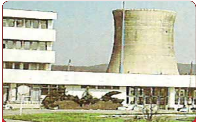
Chemická výroba v Strážskom, dnešnom Chemku, a.s. Strážske sa začala v roku 1952 výstavbou továrne s výrobou zameranou na produkciu výbušnín a medziproduktov určených pre vojenské a civilné účely. V deväťdesiatych rokoch sa však situácia na trhu zmenila, ekonomicky neefektívna výroba výbušnín bola na konci roka 2003 pozastavená a 1. januára 2005 definitívne ukončená.