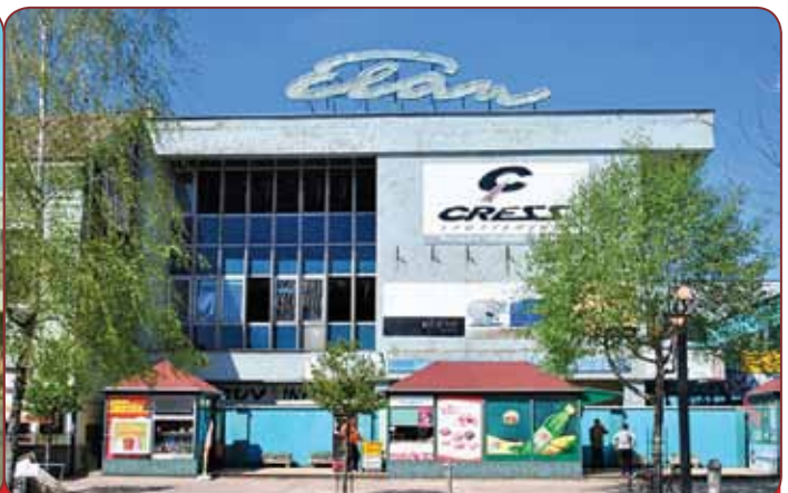
Obchodný dom Elán v centre dnešnej Pešej zóny. Voľakedy najnavštevovanejší Obchodný dom v Michalovciach, dnes chátrajúca ružina.