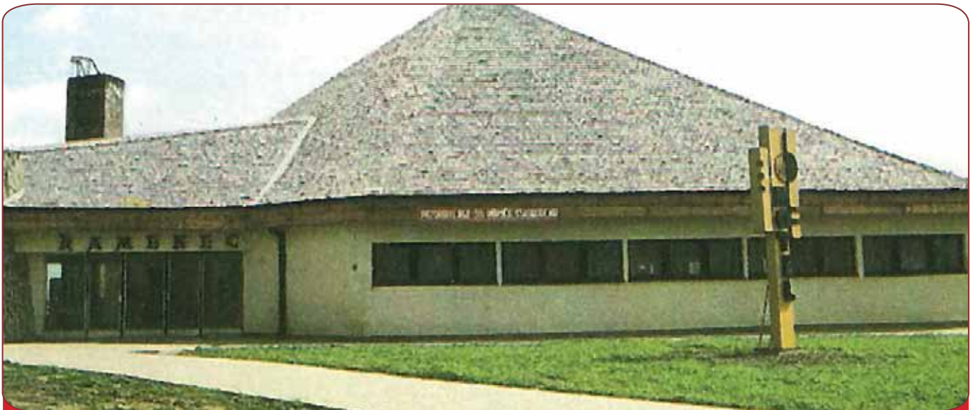
Motel Kamenec na Zemplínskej sírave., ktorý bol postavený v roku 1974.