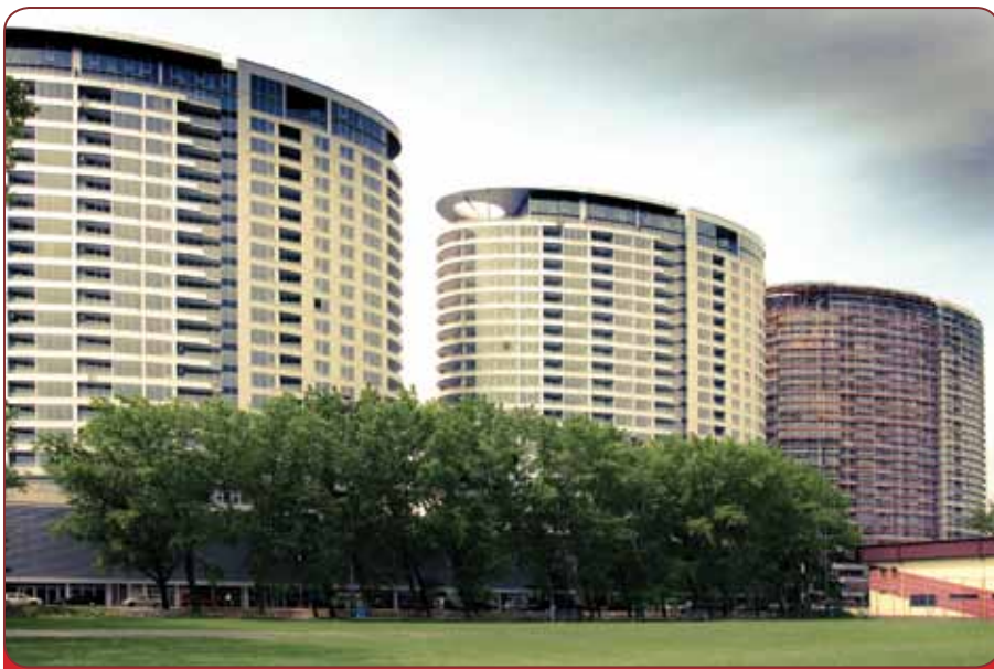
Obytný komplex III Veže v Bratislave. Je situovaný pri futbalovom štadióne ŠK Slovan Bratislava. Tri Veže bol projekt, kde sa preinvestovalo viac ako 56 miliónov Eur.

U našich východných susedov sme sa podieľali na modernizácii Elektrárne Starobeševo. Zároveň sme postavili viacero obchodných reťazcov a hotelov. V neposlednom rade sme realizovali aj hraničný priecho Vyšné Nemecké - Užhorod, ktorý je veľmi frekventovaným