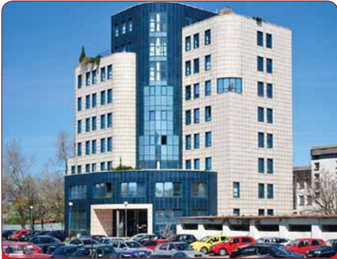
Daňový úrad v Michalovciach sme postavili v roku 199.... Stále patrí k najmodernejším stavbám Michaloviec.