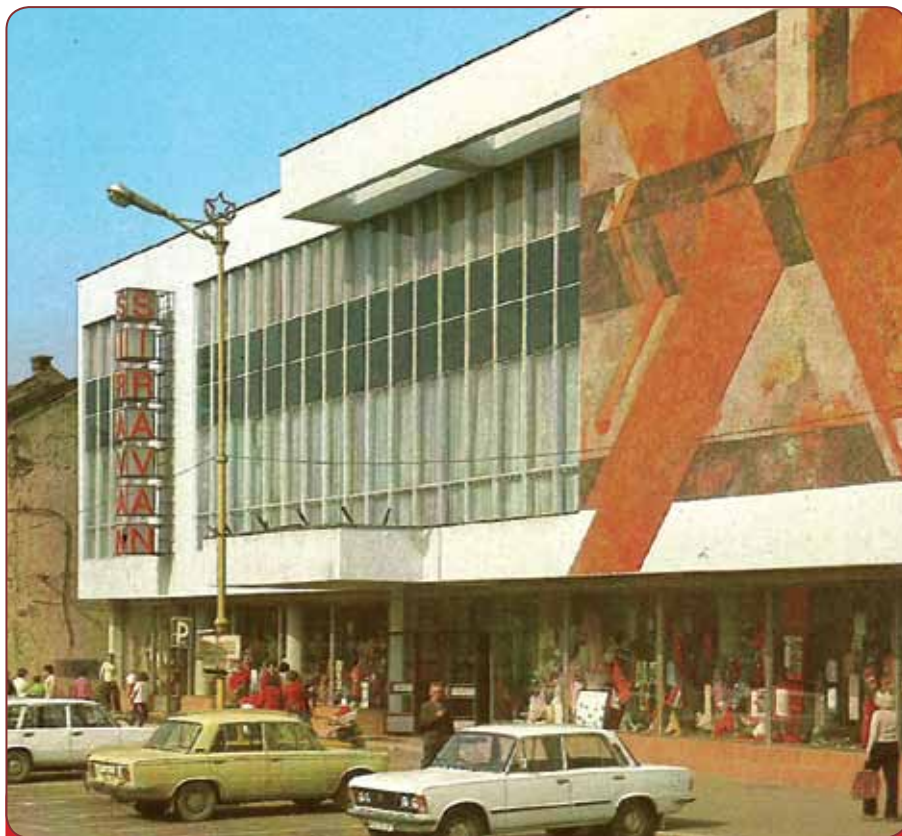
Obchodný dom Šíravan bol svojho času jedným z najväčších obchodných domov v Michalovciach.