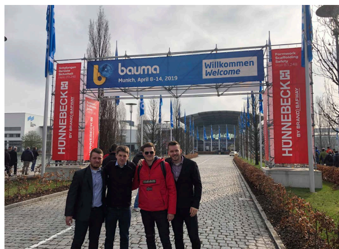
Zamestnanci Chemkostavu na výstave BAUMA 2019

V apríli sa v Mníchove opäť konal prestížny popredný svetový veľtrh pre všetkých stavbárov BAUMA 2019. Na pozvanie spoločnosti DOKA sa veľtrhu zúčastnili naši štyria kolegovia, na ktorých v Mníchove čakal celodenný aktívny program v rámci veľtrhu aj mesta.