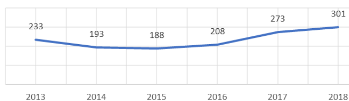
Priemerný počet zamestnancov za rok

Približne od leta sme nepreplácali a neorganizovali žiadne z kultúrnych a športových aktivít, ktoré sme dovtedy podporovali.