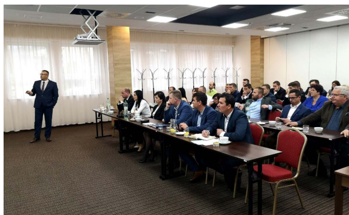
Zamestnanci spoločnosti počas rozborov HV