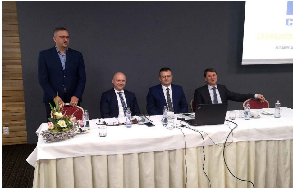
Vedenie spoločnosti počas rozborov HV

Ročný rozbor sa konal v Hoteli Alexander v Bardejovských Kúpeľoch, ktorý sa stal obľúbenou lokalitou počas posledných rokov. Po pracovnom dni nasledovala spoločná večera a večerný neformálny program.