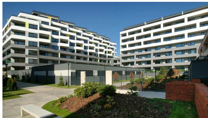
Rezidencia pri radnici

Naša stavba v Košiciach, Rezidencia pri radnici, ktorú sme realizovali pre investora CTR Group, a.s. bola zaradená medzi stavby v súťaži STAVBA ROKA 2018. Výsledky súťaže budú zverejnené koncom marca 2019.