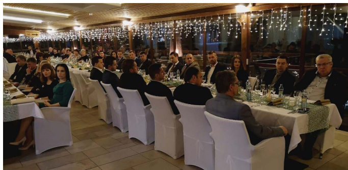
Zamestnanci na vianočnom večierku

Zamestnanci Chemkostavu sa po roku opäť vrátili do Hotela Vinay na Vinianskom jazere pri príležitosti ukončenia pracovného roka 2018. Spoločná večera sa konala pred začiatkom Vianočných sviatkov vo štvrtok 20.12.2018.