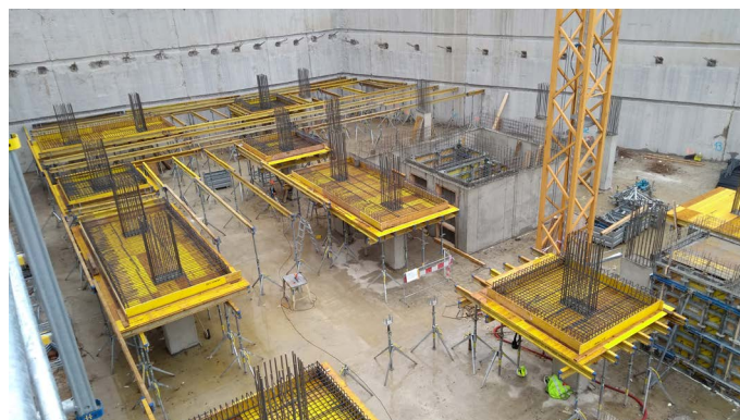
Výstavba Bastionu v novembri

Budova bude mať sedem nadzemných podlaží, ktoré budú slúžiť primárne pre zriadenie kancelárií a biznis centier, doplnené o obchodné prevádzky a služby. Parkovací dom s kapacitou 230 parkovacích miest bude umiestnený na troch podzemných podlažiach. Výstavba skeletu potrvá do augusta 2019.