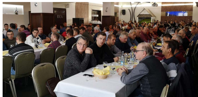
Zamestnanci v reštaurácii IDEA

Ani v roku 2019 sa so zahájením pracovného roka neatáľalo a začali sme hneď zostra. V stredu 2. januára sa v reštaurácii IDEA v Michalovciach konalo oficiálne začatie pracovného roka 2019. Aj keď sme začínali pracovný rok s trochu menším počtom zamestnancov ako tomu bolo v roku 2018, na priestoroch reštaurácie to ani nebolo badať – reštaurácia bola takmer do posledného miesta naplnená.