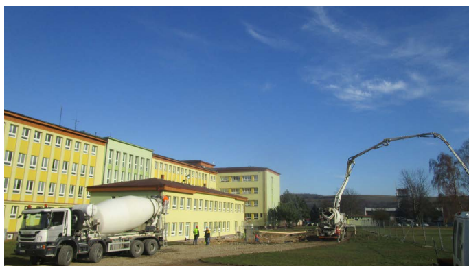
Začiatok prác v Bardejove

Termín podpísania zmluvy je zároveň aj termínom začiatku realizácie výstavby, ktorá potrvá 30 mesiacov, do roku 2021.