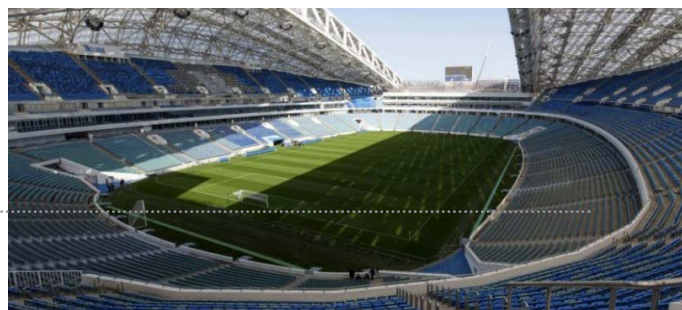
ilustračné foto, zdroj: TASR

Symbolickým výkopom futbalovej lopty sa v októbri začali stavebné práce na prvej etape Košickej futbalovej arény (KFA). Hotová má byť do konca roka 2019. Financovanie projektu v plnom rozsahu zatiaľ zabezpečené nie je. Celkové náklady na všetky tri etapy výstavby dosiahnu 19,47 milióna eur bez DPH.