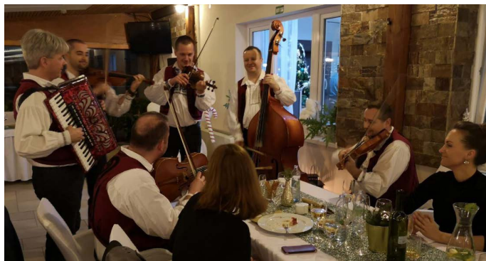
Folklórny súbor Zemplín

Samozrejme na večierku nesmel chýbať folklórny súbor Zemplín, ktorý zabezpečil zábavu do skorých ranných hodín.