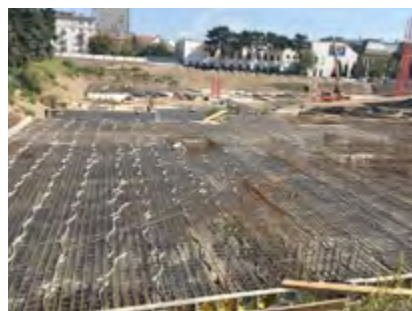
Príprava základovej dosky

Stále nás čakajú ďalšie výzvy. Zmenili sme totiž typ debnenia, ktorý bol doteraz vo firme používaný. Systém je síce podobný, ale nie totožný a práve preto, je nutné ľudí zaškoliť. Špecifikom je aj lokalita projektu. Vyžaduje si to vysoké nároky na logistiku, keďže tu nemáme priestor na skládkovanie materiálov ako sme zvyčajne zvyknutí na iných stavbách. Dá sa povedať, že vzhľadom na unikátnosť stavby, získavame všetci nové skúsenosti. Denne riešime množstvo otázok a robíme všetko preto, aby stavba nestála a plnili sa stanovené termíny. Vzhľadom na novo vyskladaný tím ľudí, nás zatažuje aj plnenie agendy voči vlastnej firme, ktorú ešte nikto z nás dokonale neovláda.