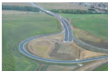
Začiatok úseku R2 Zvolen - Pstruša