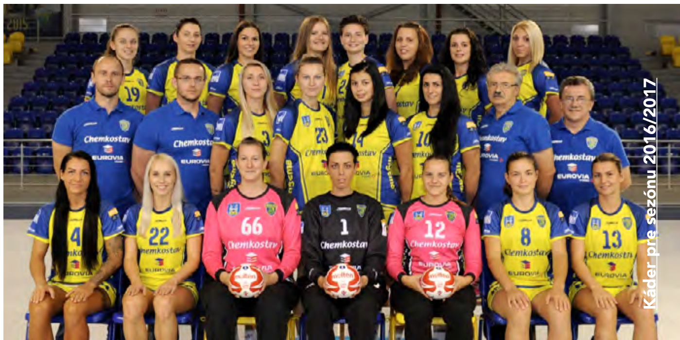
Káder pre sezónu 2016/2017