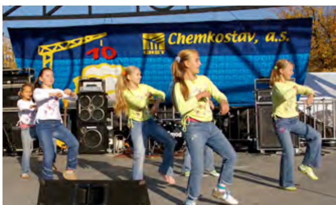
Vystúpenie talentov - 10. výročie založenia firmy