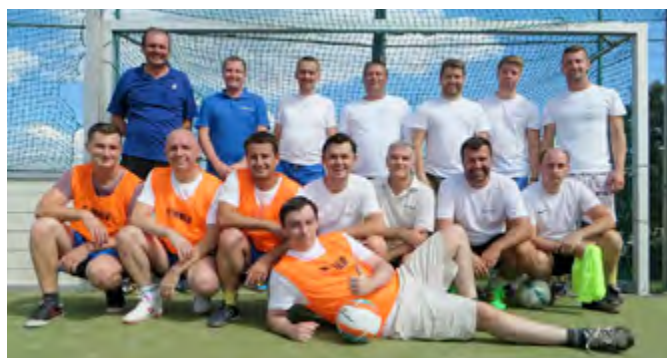
Futbalisti po zápase

Chemkostaváci mali dátum 12. august dlho blokovaný vo svojich kalendároch.