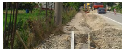
Vybudovanie celoobecnej kanalizácie v obci Dietoma