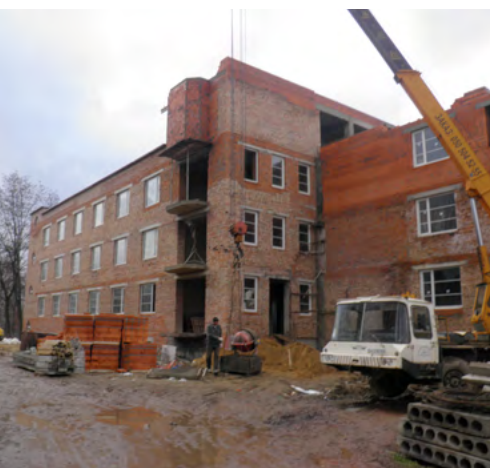
Nemocnica Nižná Apša

To, čo sa deje momentálne na Ukrajine je nepríjemné nielen z ľudského hľadiska. Ozbrojený konflikt sa týka aj Slovenska, keďže ide o nášho východného suseda a priamo aj spoločnosti Chemkostav, a.s. Michalovce. Firma totiž na tomto území už v minulosti realizovala množstvo projektov, ba čo viac, v organizačnej štruktúre spoločnosti je začlenená aj tu pôsobiaca pobočka.