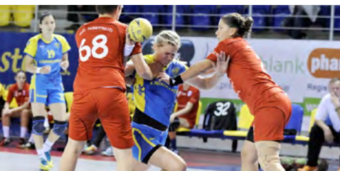
Zápas Luventa Michalovce – KHF Kastrioti

Po funkcionárskych naťahovačkách nakoniec súper súhlasil, aby sa oba zápasy druhého kola odohrali v Chemkostav Aréne.