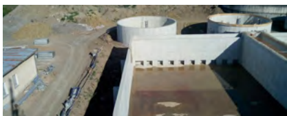
Trebišov - odkanalizovanie ulíc a rozšírenie kapacity ČOV