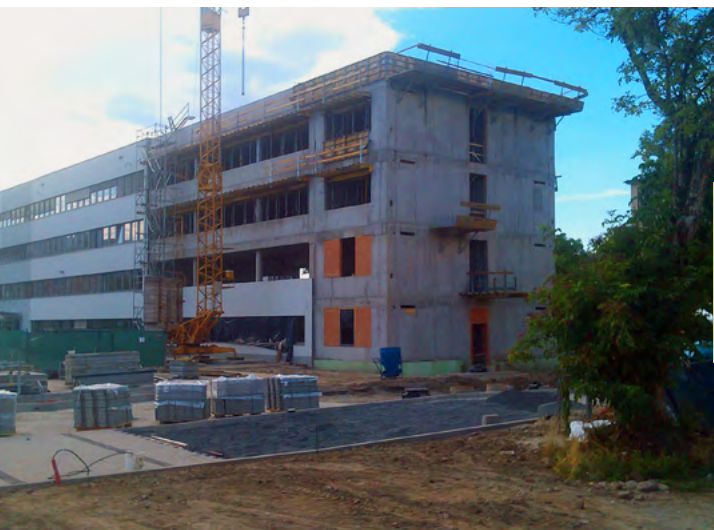
Budova počas rekonštrukcie

Zrejme to, čo sa ukrýva za vonkajším plášťom celej stavby. Pri pohľade na hotový projekt, pravdepodobne už nikoho nenapadne, že tam sú vlastne dva samostatné objekty. Tri poschodia nadstavby, boli totiž umiestnené na už existujúcu prízemnú časť, ktorá na to bola už v minulosti dimenzovaná. Hneď vedľa, no v tesnej blízkosti tohto celku, bola zároveň realizovaná nová štvorposchodová časť s vlastnými základmi o rozmeroch 13 metrov x 6 metrov. V konečnom dôsledku, sú všetky tieto objekty vzájomne prepojené a tvoria jeden celok.