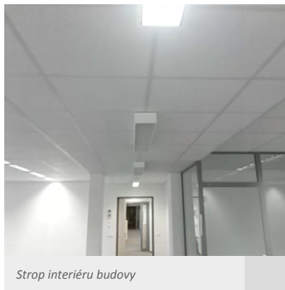
Strop interiéru budovy

Určite je potrebné spomenúť investora projektu, ktorou je spoločnosť Lidl. My sme pracovali priamo pod oknami tých, ktorí si nás objednali. Každý náš deň na stavbe, preto prakticky vyzeral ako keby bol kontrolný. Išlo teda o permanentný dohľad investora pri každej činnosti. Takáto konštelácia podmienok je v stavbárskej praxi dnes už skôr raritou.