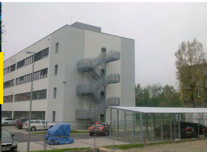
Budova po rekonštrukcii