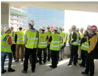
Projekt Panorama City

„Stavebnú firmu Chemkostav, a. s. Michalovce považujeme za jednu z naj-