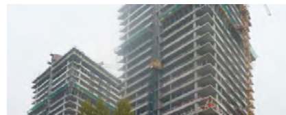
Polyfunkčný súbor PANORAMA CITY, Bratislava - I. Etapa