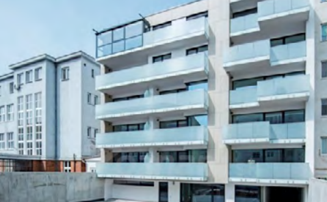
Bytový dom s polyfunkciou Grösslingova 50

O priazeň verejnosti a rovnako aj odbornej poroty sa uchádzajú stavby Rezydencia Šafranová záhrada a Bytový dom s polyfunkciou Grösslingova 50.