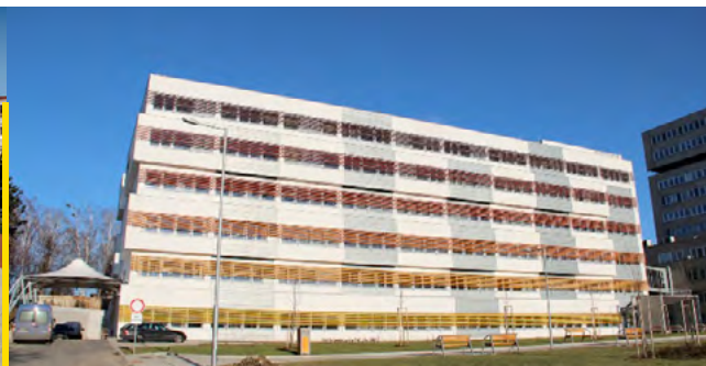
FNŠP J.A.Reimana Prešov - Internistický monoblok