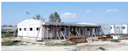
Výstavba a rekonštrukcia objektov v komplexe väznica – nápravné zariadenie IDRIZOVO