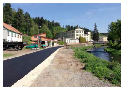
Ochrana vôd v povodí rieky Dyje – II. etapa

Je pravda, že kým sektor stavebníctva v dôležitých ukazovateľoch klesal, my sme stúpali. Ide o výsledok práce ľudí, ktorí sa podieľali na každodennej činnosti firmy. Zamestnanci rýchlo pochopili, že sa musíme prispôsobiť aby sme prežili, aj keď nešlo vždy iba o populárne opatrenia. Patrí im za to veľká vďaka.