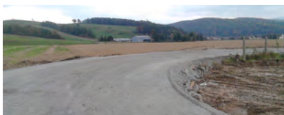
Rýchlostná cesta R2 Zvolen východ – Pstruša