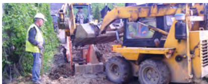
Čistá řeka Bečva II-A