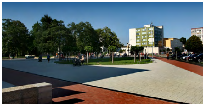
Regenerácia centrálnej mestskej zóny mesta Michalovce