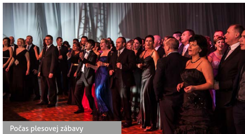
Počas plesovej zábavy