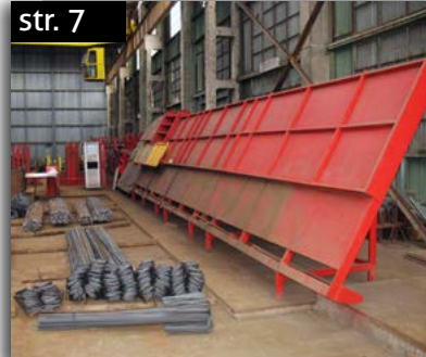
Ohýbareň a doprava