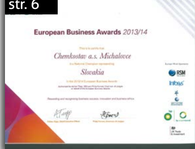
European Business Awards