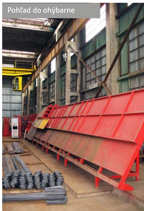
Pohľad do ohýbarne

Spoločnosť Chemkostav, a.s. prístupuje v tomto období k radikálnym, no nevyhnutným opatreniam. Cieľom je optimalizácia na každom kroku. Aj preto padlo dôležité rozhodnutie v prípade strediska Ohýbareň.