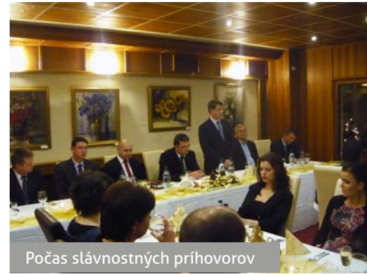
Počas slávnostných príhovorov

Kolektív v Chemkostave na mňa pôsobí veľmi pozitívne. Kolegovia sú ústretoví a ochotní. Na večierku sa ukázalo, že nie sú zohratí len v práci, ale aj na