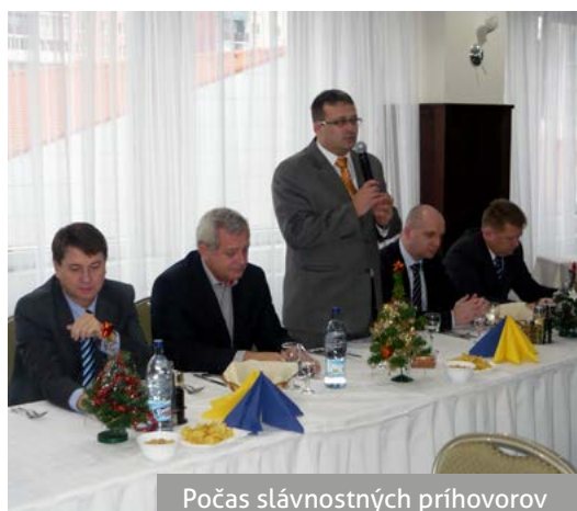
Počas slávnostných príhovorov

posledné obdobie, sme odhodlaní tvrdou prácou zachovať spoločnosti Chemkostav, a.s. popredné miesta v rebríčku top stavebných firiem na Slovensku. Byť neustále lepší, úspešní a schopní trvalo spoločnosť rozvíjať, to boli aj želania vedenia spoločnosti, počas svojich príhovorov