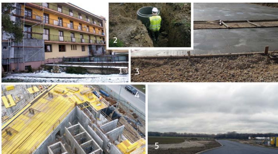
1. Rekonštrukcia a modernizácia ZpS a DSS Trebišov; 2. Čistá reka Bečva II-A; 3. Výstavba a rekonštrukcia objektov v komplexe väznica – nápravné zariadenie IDRIZOVO; 4. Polyfunkčný súbor PANORAMA CITY, Bratislava - I. Etapa; 5. Južné mesto - primárna infraštruktúra - vodohospodárske siete