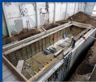
„Rozvoj infraštruktúry a modernizácia vybavenia TU v KE“