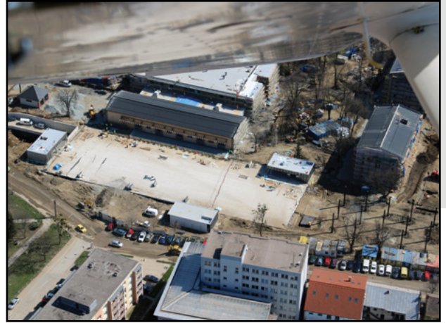
letecký záber na kasárne - KULTURPARK

Stavebný objekt je situovaný v 1. podzemnom podlaží pod urbánnu plochou. Parkovisko predstavuje objekt infraštruktúry, slúžiaci na zabezpečenie statickej dopravy pre komplex Kulturparku. V objekte je 115 parkovacích miest, z toho 4 sú určené pre handicapované osoby. Jedná sa o hromadné garáže na ploche cca 3800 m 2 s kontrolovaným vjazdom a výjazdom. Časť objektu je dvojúčelovou stavbou, zabezpečujúcou okrem funkcie parkovania aj funkciu úkrytu civilnej ochrany s kapacitou pre 500 osôb. Pohyb ľudí je v celom tomto komplexe zabezpečený dvoma komunikačnými jadrami so schodiskom a výtahom. Komunikačné jadrá sú doplnené o priestory hygienického zázemia, priestory technického zabezpečenia a údržby.