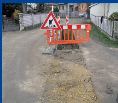
„Dobudovanie stokovej siete v aglomerácii obce Čachtice“