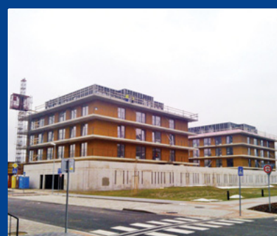
„Južné mesto ZÓNA C1 - 2. etapa, Mestské vily Sever“