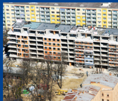
„Rezidencia Šafranová záhrada“