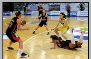
DOBRI ANJELI V NAJLEPŠEJ EURÓPSKEJ ŠTVORKE str. 8