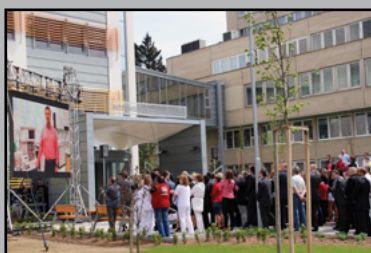
SLÁVNOSTNÉ OTVORENIE INTERNISTICKÉHO MONOBLOKU str. 4