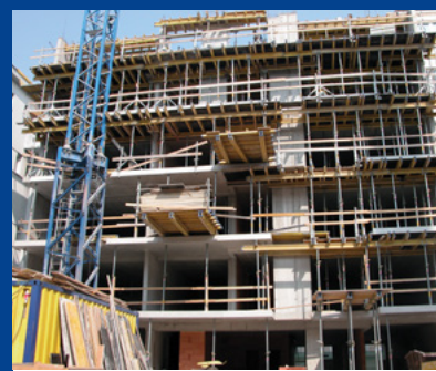
„Bytový dom s polyfunkciou Grösslingova 50, Bratislava“