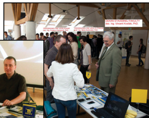
prezentačný stôl CHST