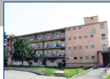
stav pred rekonštrukciou

Celý komplex tohto zariadenia je tvorený štyrmi samostatne stojacimi objektmi, ktoré sú vzájomne prepojené, čím je umožnený prístup do všetkých častí. Po ukončení prác vzniknú v štvorpodlažnom pavilóne A, rovnako aj pavilóne B, predovšetkým izby s vyšším štandardom a samostatnou hygienou. Pomerne výrazná zmena nastane aj v pavilóne C, ktorý tvorí hlavný vstup do celého komplexu. Jestvujúce priestory sa tu zmenia na zónu rehabilitácie a relaxácie.