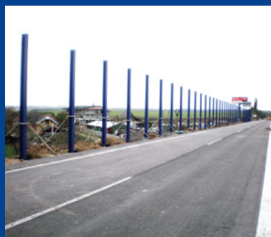
„Rýchlostná cesta R1 Lehota - protihlukové opatrenia“