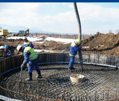
„Čaklov-zvýšenie kapacity ČOV“