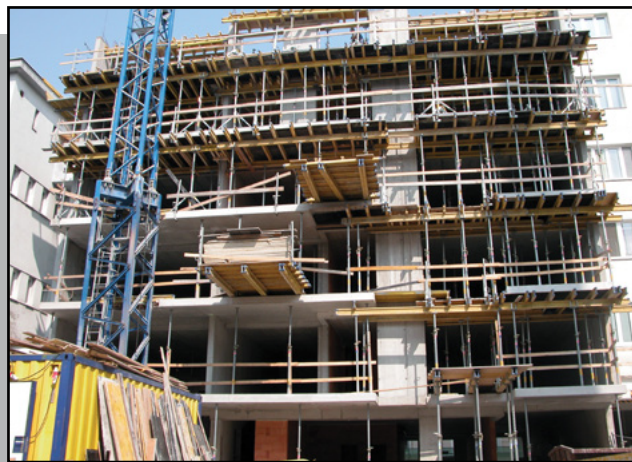
rozostavaný bytový dom

Klienti sa môžu tešiť na vkusný objekt, ktorý je vsadený do zástavby Starého mesta. Je to komornejší projekt vzhľadom na to, že v objekte bude len 13 bytových jednotiek a jeden obchodný priestor. Ľudia budú mať zabezpečené aj jednoduché a bezpečné parkovanie, priamo v suteréne objektu. K dispozícii budú mať átrium, alebo inak nazývaný dvor s altánkom a zeleňou, na ktorý budú mať prístup len obyvatelia tohto bytového domu.