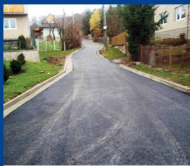
„Regenerácia sídiel s rómskym osídlením v obci Zemplínska Teplica“