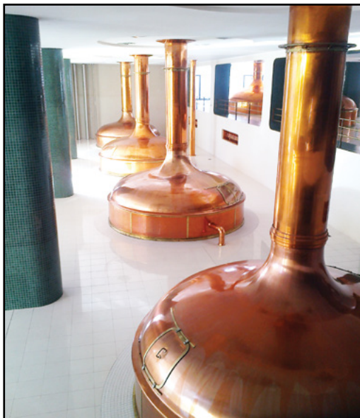
pivovar Pilsner Urquell