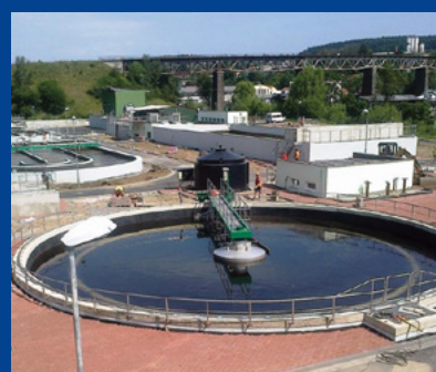
„Ochrana vôd v povodí rieky Dyje – II. etapa“