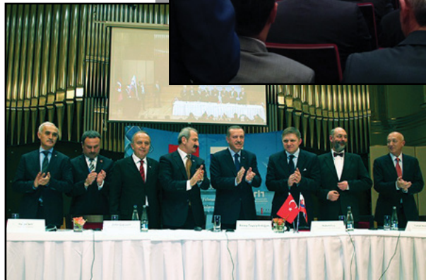
Hore: podnikatelia a minister hospodárstva Turecka Dole: vládni predstavitelia Slovenska a Turecka