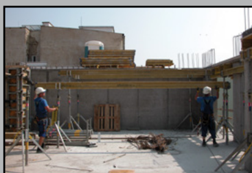
NAVŠTÍVILI SME STAVBU „GRÖSSLINGOVA 50“ str. 5